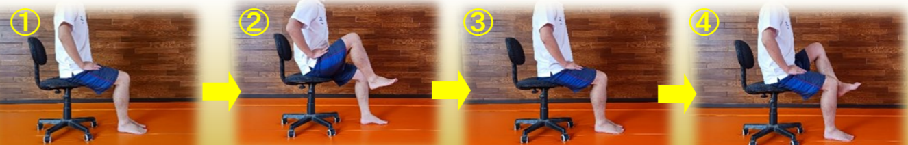
①椅子に腰かけ ②右足の太ももをあげる ③右足を元に戻して ④左足の太ももをあげる

★足を交互に上げ、20回を3セット行うと効果抜群★出来れば毎日!! (記事：細川委員)